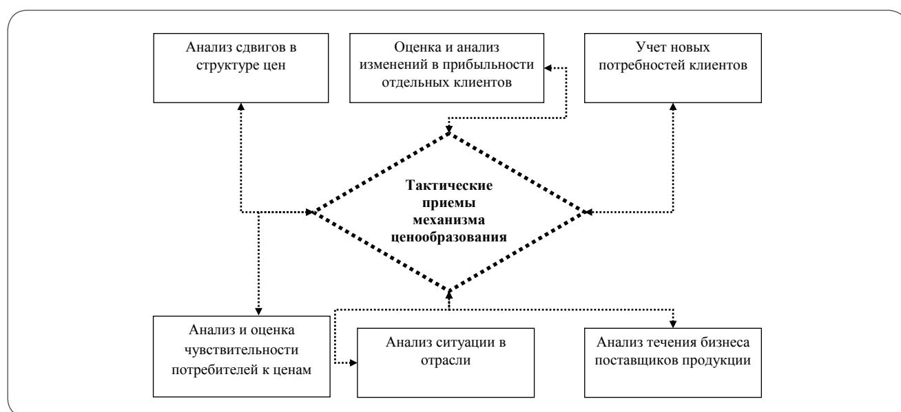
Рис. 3. Тактические приемы механизма ценообразования*

4. Анализ и оценка чувствительности потребителей к ценам. Так как рыночные цены меняются, а данные их анализа устаревают, то торговому предприятию в политике оптимального ценообразования поможет непрерывный анализ чувствительности потребителей к ценам.