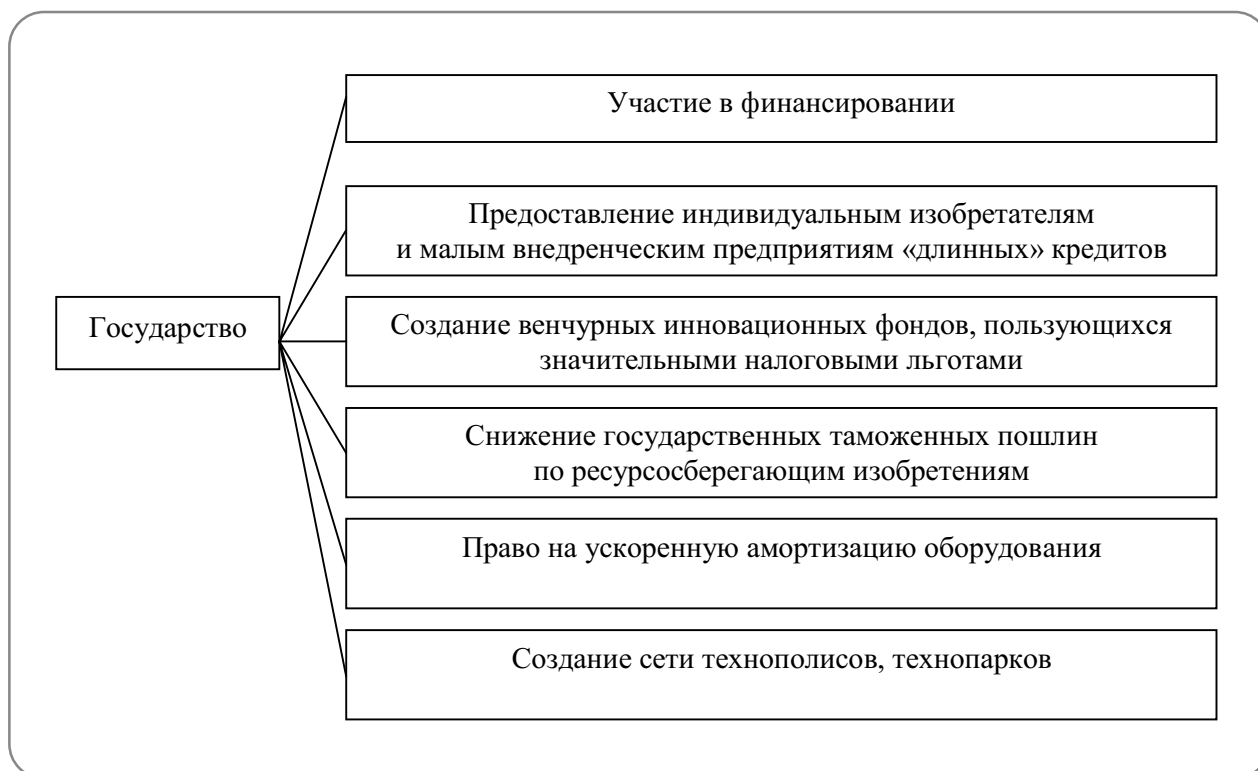
Рис. 1. Основные формы ЧГП инновационной деятельности в целях экономического роста

Первая форма. Государственный сектор и частные партнеры присоединяются к существующей компании или совместно создают смешанную компанию. Главная характеристика смешанной компании – объединение государственных и частных инвестиций, посредством чего в совете директоров фокусируются различные цели. Участие государственного сектора распространяется до степени получения блокирующего меньшинства и тем самым государство приобретает достаточное влияние в компании.