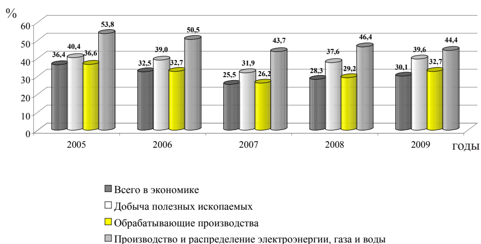
Рис. 1. Удельный вес убыточных организаций, %