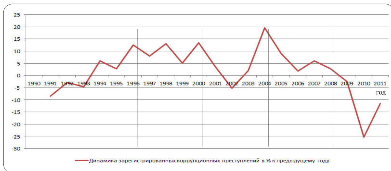
Рис. 3. Политический деловой цикл противодействия коррупции (вертикальными линиями отмечены президентские выборы) [7]

В России 2010-х гг. институциональная коррупция объективно играет роль рудимента командной экономики. Коррупционные институты воспроизводят отношения власти-собственности, когда доступ к