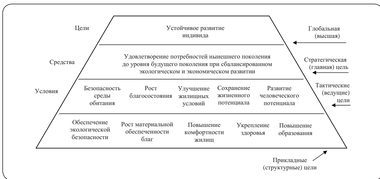
Рис. 3. Пирамида приоритетных целей устойчивого развития экономики города как результат совершенствования стратегического планирования и проведения мониторинга социально-экономического состояния города

Структурирование приоритетов по обеспечению устойчивого развития экономики города в аспекте совершенствования стратегического планирования, нами выполнено исходя из социальной ориентации устойчивого развития, что обусловлено тем, что в центре муниципальной политики находится человек и его потребности (рис. 3).